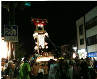
【動画1】神輿フルボッコ 【動画2】川の中でも……

山代の菖蒲湯祭りの祭りの比ではない。壮大さが違う。老若男女が深夜でも祭り会場にすることがすごい！ 青柏祭といい、石川県の能登地方はすごい隠しダマを持ってたぜ(◡_◡) こういうところに来れるのは、やっぱりかがこま倶楽部ならではのかな♪ いろんな祭りに行きたいぜ！